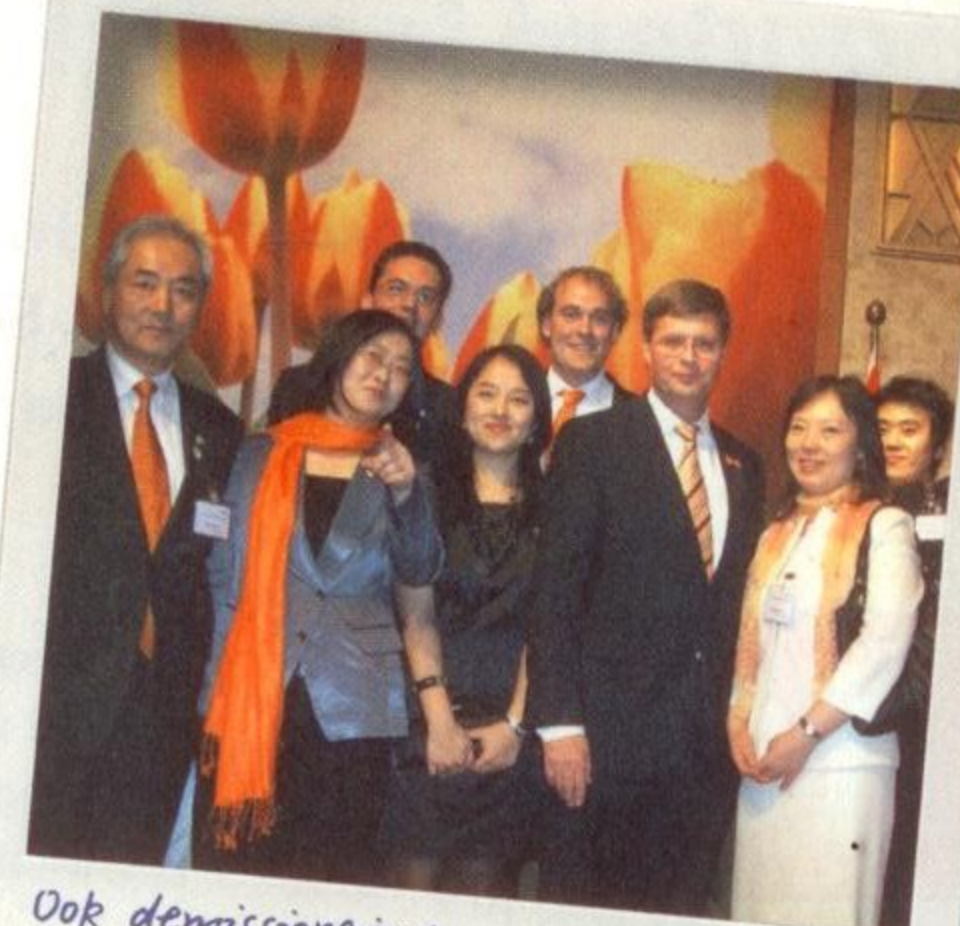
Ook demissionair premier Balkenende was in Zuid-Korea

Doordat wij met een officiële delegatie in het kielzog van demissionair premier Balkenende reisden, en alle contacten werden gelegd door de Nederlandse ambassade en KOTRA (een soort Koreaanse NL EVD Internationaal), konden we gesprekken voeren met de top binnen het Koreaanse bedrijfsleven. Ik denk dat dit op een andere manier voor ons niet zou zijn gelukt." ■